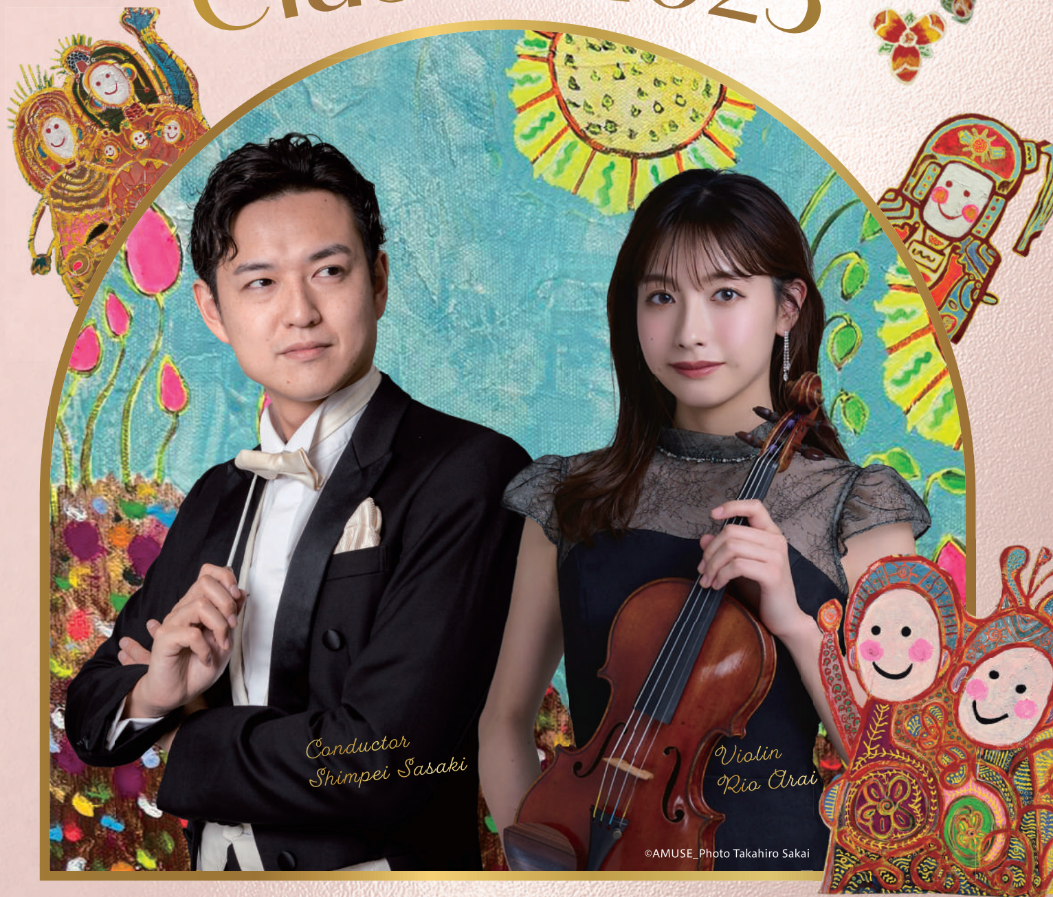
Conductor Shimpei Sasaki