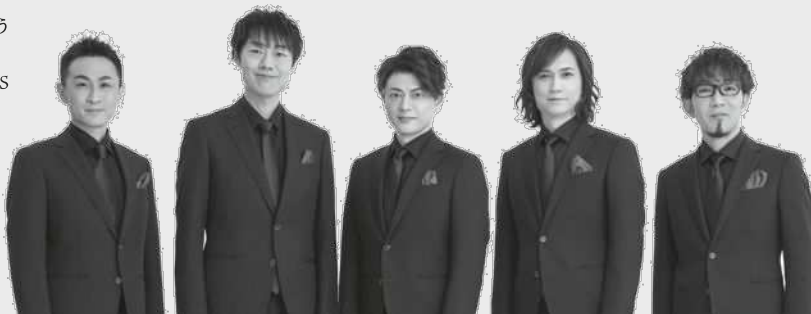
Baby Boo CHORUS GROUP

NHK R1「らじるラボ」(2020年4月～2022年9月)、BS朝日「人生、歌がある」毎週土曜19時～レギュラー出演中。