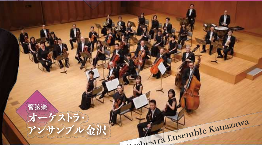
管弦楽 オーケストラ・ アンサンブル金沢