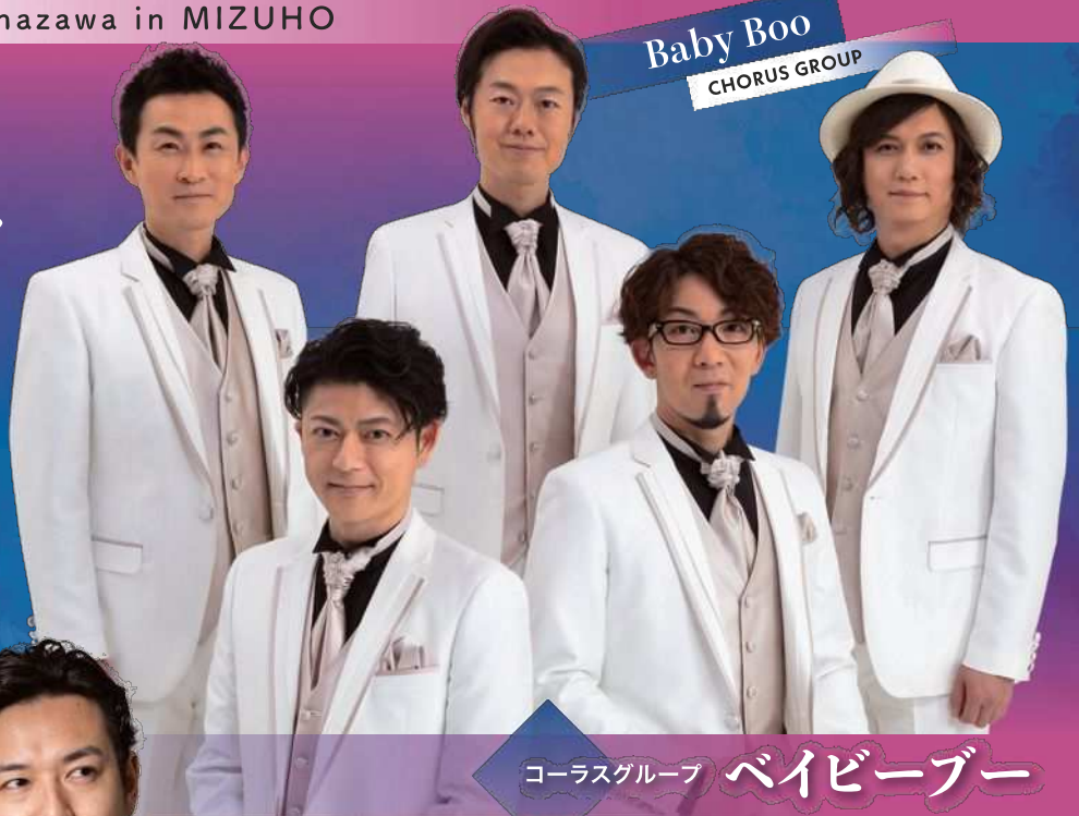
Baby Boo CHORUS GROUP