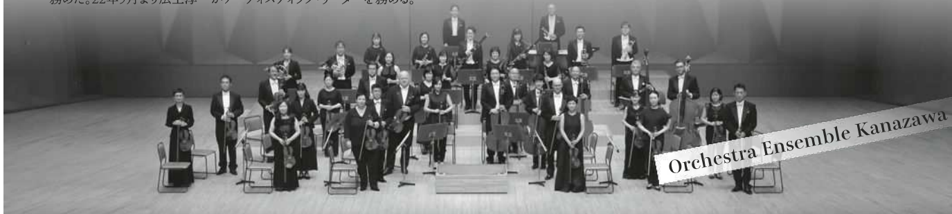
Orchestra Ensemble Kanazawa

1988年、岩城宏之が創設音楽監督(永久名誉音楽監督)を務め、多くの外国人を含む40名からなる日本最初のプロの室内オーケストラとして石川県と金沢市が設立。石川県立音楽堂を本拠地とし、北陸、東京、大阪、名古屋での定期公演など年間約100公演を行っている。ジュレスヴィヒ=ホルシュタイン音楽祭、ラ・ロック・ダンテロン国際ピアノフェスティバルなど、音楽祭からの招聘を含む20度の海外公演を実施。設立時よりコンポーザー・イン・レジデンス(現コンポーザー・オブ・ザ・イヤー)制を実施、多くの委嘱作品を初演、CD化している。オーケストラ育成・普及活動にも積極的に取り組んでいる。ドイツグラモフォン、ワーナーミュージックジャパン、エイベックスなどメジャーレーベルより90枚を超えるCDを発売。07年より18年3月まで、井上道義が音楽監督を務め、18年9月よりマルク・ミンコフスキが芸術監督を務めた。22年9月より広上淳一がアーティストック・リーダーを務める。