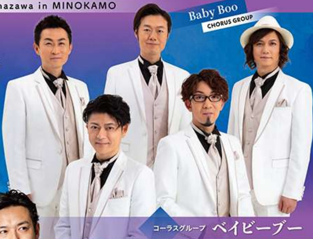
Baby Boo CHORUS GROUP