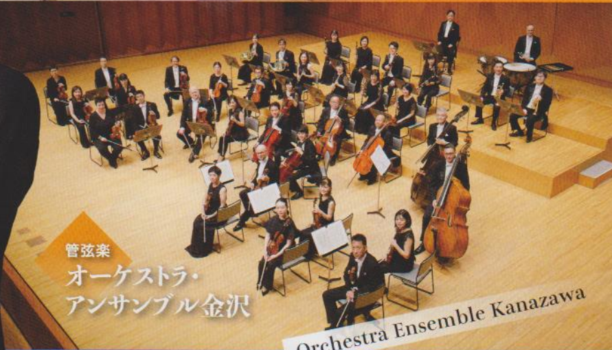
管弦楽 オーケストラ・ アンサンブル金沢