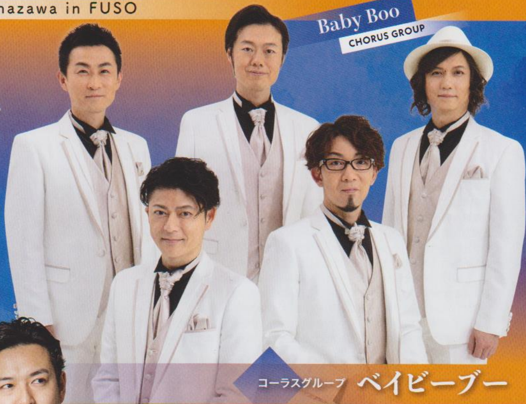
Baby Boo CHORUS GROUP